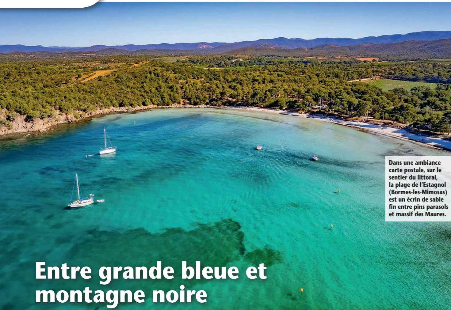
Dans une ambiance carte postale, sur le sentier du littoral, la plage de l'Estagnol (Bormes-les-Mimosas) est un écrin de sable fin entre pins parasols et massifs des Maures.