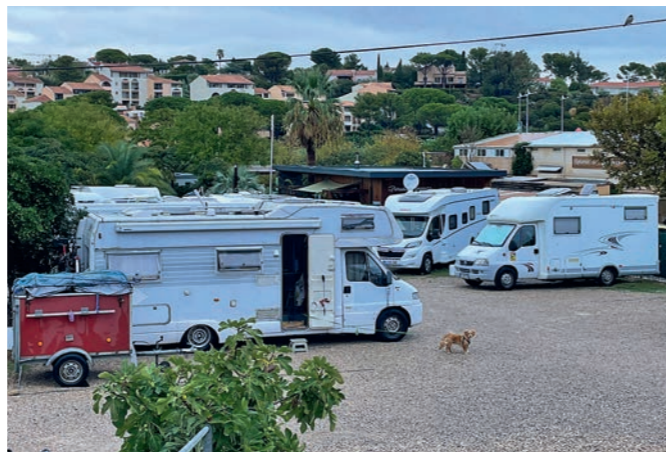
Les Issambres, à Roquebrune-sur-Argens: l'aire Chez Marcel offre une halte sympathique avec des emplacements larges.