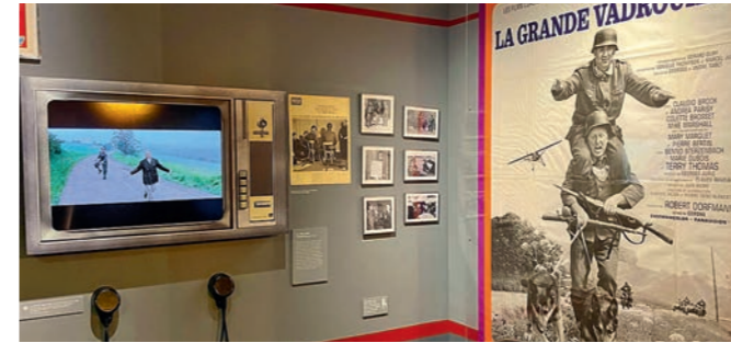
Danser sur Rabbi Jacob, revoir des scènes d'anthologie... Le musée Louis de Funès à Saint-Raphaël est le seul musée dédié à l'acteur.