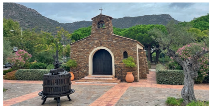
Station balnéaire aux douze plages, Le Lavandou est un charmant petit village de petites chapelles, comme ici celle de Saint-Clair.