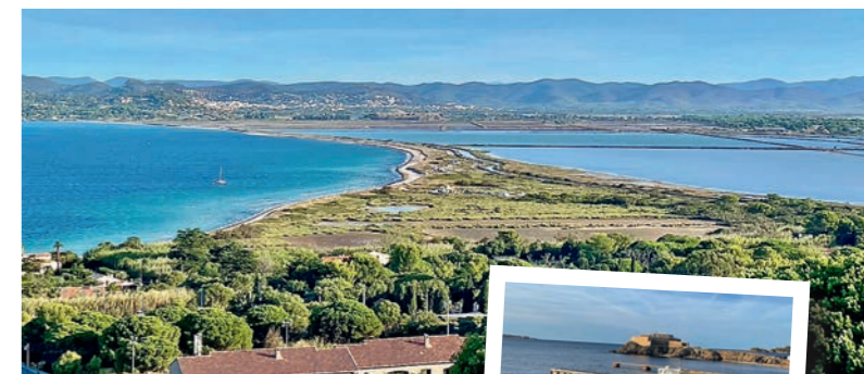
Ancrée au continent par un double tombolo, la presqu'île de Giens est une curiosité géologique. En contrebas du camping La Tour fondue, départ pour Porquerolles...

Lien dédié aux camping-cars : visitvar.fr