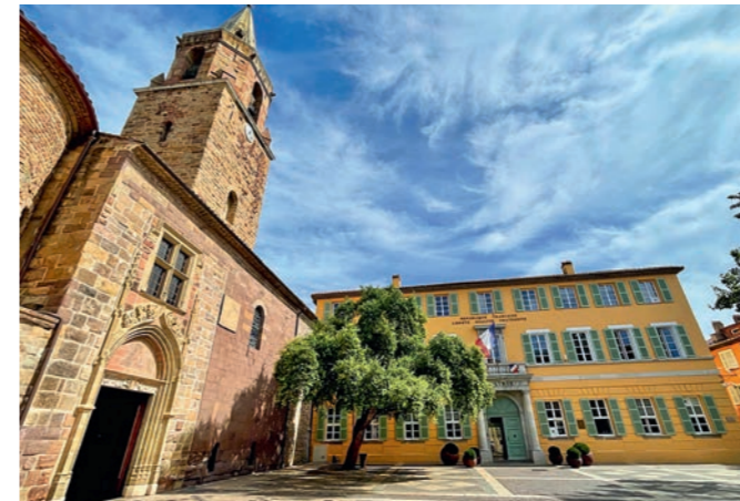
À l'écart des plages, le cœur historique de Fréjus permet de découvrir une autre facette patrimoniale de la ville balnéaire.

la ville à la préservation de la nature. Comme à son patrimoine marin: sur les quais de la marina, les « Sentiers du mérou » sensibilisent à la sauvegarde de la biodiversité sous-marine. En masque et tuba, le sentier se prolonge autour de « biohuts », ces nurseries artificielles qui protègent les poissons des prédateurs. Dans sa partie historique, Fréjus dévoile un autre visage: arènes, aqueduc romain, cathédrale avec son baptistère et son cloître, mais aussi ruelles provençales à l'esprit parfois « arty », et son Musée des troupes de marine françaises. Unique, ce lieu de mémoire fait revivre l'histoire des guerres et des colonisations et avec elles l'épopée des bataillons (campagnes de l'Empire, conquête de l'Indochine, guerres mondiales...) illustrées à travers des collections d'uniformes, objets-reliques, équipements, armes... Mais c'est vers une autre histoire qu'il faut désormais regarder. Celle de l'Esterel. Ou plutôt l'« Esterelle »? Cette fée légendaire de la fécondité que l'on remerciait pour avoir donné la vie... Au pied de cette terre géologiquement fertile de 250 millions d'années, le vignoble de la famille Paquette se développe depuis 1952: 25 ha en agriculture bio en AOP côtes-de-provence et