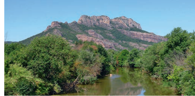
Depuis la route, l'impressionnant rocher de Roquebrune annonce le décor rouge de l'Estérel.