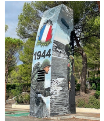
L'esplanade de la plage du Dramont de Saint-Raphaël conserve le souvenir du débarquement de 1944, illustré façon street art par Braga Last One et Nyota.

Encore quelques kilomètres dans les courbes de l'Esterel et la route atteint les Alpes-Maritimes, où le massif meurt en contreforts sur Mandelieu-la-Napoule.