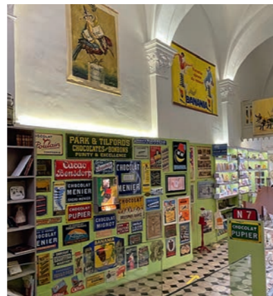
La Maison du chocolat et du cacao a pris place dans une ancienne chapelle XVII e de Roquebrune-sur-Argens.

tion chocolatière. La Maison du chocolat et du cacao réunit une collection de 1000 objets dans une chapelle 17 e siècle: boîtes et chocolatières anciennes, plaques émaillées publicitaires, moules... et un rare automate Banania des fifties. Plus encore! Un artisan chocolatier a même immortalisé le Rocher et créé des produits inédits, dont des tablettes aux fourmis! Vers Puget-sur-Argens, la route accroche une vue carte postale sur le géant de pierre depuis le lac de l'Arena. Alors que vous gagnez les contreforts de l'Esterel, halte au Village des artisans créatifs. Dans ce lieu écoresponsable, aménagé dans des conteneurs maritimes recyclés, on trouve des produits locaux bien gourmands. La route file alors sous les pins parasols et descend à Fréjus-Saint-Aygulf au parc Arca: les collections botaniques en front de mer signent l'attachement de