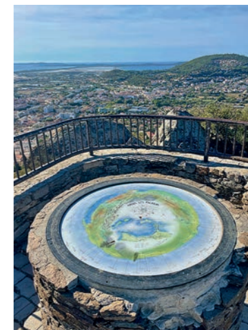
Au sommet d'Hyères-les-Palmiers, les vestiges du château offrent un beau panorama sur les îles de Porquerolles et le massif des Maures.