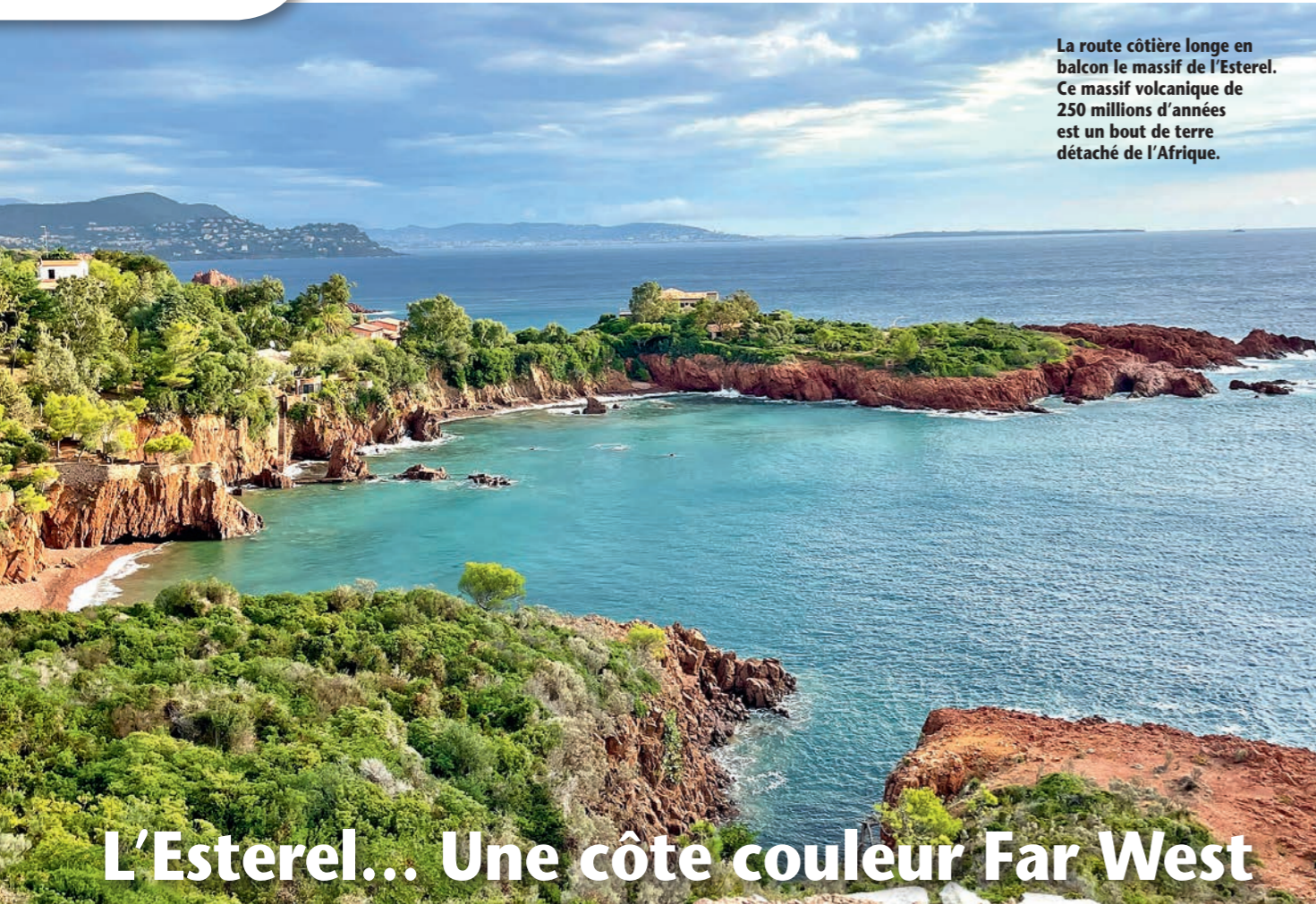
La route côtière longe en balcon le massif de l'Esterel. Ce massif volcanique de 250 millions d'années est un bout de terre détaché de l'Afrique.