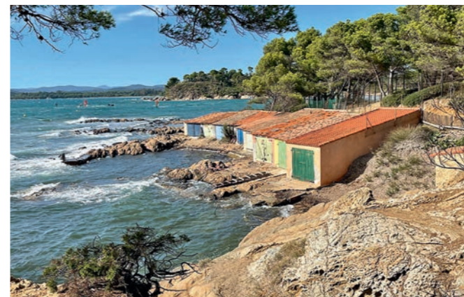
Au pied du fort de Brégançon, les cabanons de pêcheurs donnent sur la baie de Cabasson et la presqu'île de Giens.

fixer le sable et la route du Sel est fermée de novembre à Pâques pour réduire la fréquentation. Soumis à l'érosion, le tombolo ouest est menacé. » Le bourg de Giens se gagne depuis le premier parking en bas du village. Au square Bachagha Boualam, une terrasse ouvre une incroyable perspective sur ces tombolos, la baie de Hyères, Toulon, Porquerolles et le massif des Maures. En reprenant la D98 vers Bormes-les-Mimosas, la D42A mène à de grands domaines viticoles AOC-AOP côtes-de-provence. Les propriétés donnent accès à des bijoux de plages au creux du cap Bénat. Ainsi Léoube et sa plage de l'Estagnol, adresse cachée d'un lord anglais au cœur de vignes et oliviers bios ; la plage de Cabasson au pied du fort de Brégançon avec accès au sentier du littoral ; ou Château Malherbe, domaine familial en biodynamie dont le chai, aménagé dans d'anciennes cuves du 17 e , vaut le coup d'œil. Quelques encablures plus loin, Le Lavandou savoure son ambiance balnéaire au pied des Maures et ses pépites comme le domaine viticole de l'Anglade, l'un des deux leaders au monde à exploiter la canne de Provence, graminée servant à fabriquer les anches des instruments. Ou la Villa Théo, ancienne demeure du peintre Théo Van Rysselberghe. Cet artiste du 19 e est l'un des représentants du néo-impressionnisme. « mouvement qui s'inspira de la diffraction et du pointillisme