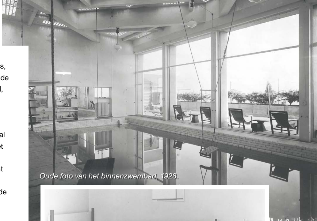
Oude foto van het binnenzwembad, 1928.

We starten onze toer in Hyères-les-Palmiers, de meest zuidelijk gelegen trekpleister van de Côte d'Azur. In de straten van de oude stad, waar duizenden wuivende palmbomen je begroeten, zijn het vooral de vorstelijke neoclassicistische villa's uit de belle-époque-periode die de aandacht trekken. Totaal anders is de bouwstijl van Villa Noailles. Het 'moderne' huis, iets hoger op de heuvel gelegen, biedt een waanzinnig mooi uitzicht over de stad en de azuurblauwe zee. Het adellijke echtpaar Charles en Marie-Laure de Noailles liet hier tussen 1923 en 1925 hun vakantiehuis bouwen. Architect Robert Mallet-Stevens ontwierp de villa met aan de buitenzijde verspringende kubussen die slim in elkaar grijpen, met een horizontale lijn en zonder enige opsmuk. Om het licht zoveel mogelijk naar binnen te halen, werden alle woonvertrekken op het zuiden gericht. Inspelend op het veranderende denkbeeld over persoonlijke hygiëne kregen alle slaapkamers een eigen badkamer. Maar daar stoppen de moderniteiten nog lang niet, want naar wens van het vermogende echtpaar werd er een inpandig zwembad gerealiseerd van gewapend beton met een gevel van glas, waarvan de ramen in de vloer konden verdwijnen: een zeer ingenieus systeem voor die tijd. Bovendien hing er in ieder vertrek een klok, die allemaal volgens een centraal systeem met elkaar verbonden waren.