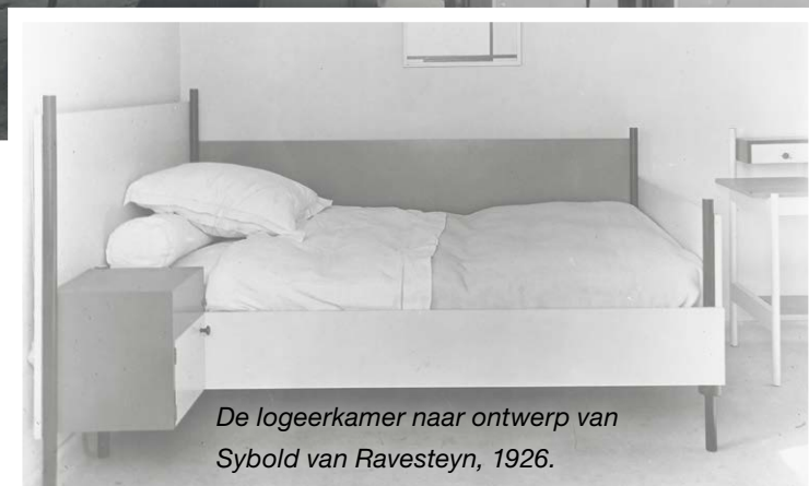
De logeerkamer naar ontwerp van Sybold van Ravesteyn, 1926.