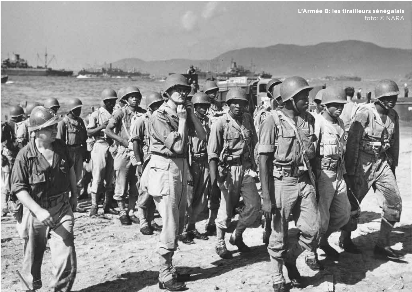
L'Armée B: les tirailleurs sénégalais