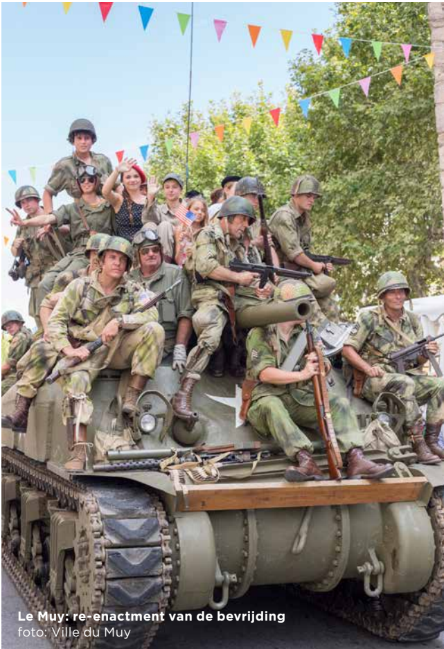
Le Muy: re-enactment van de bevrijding