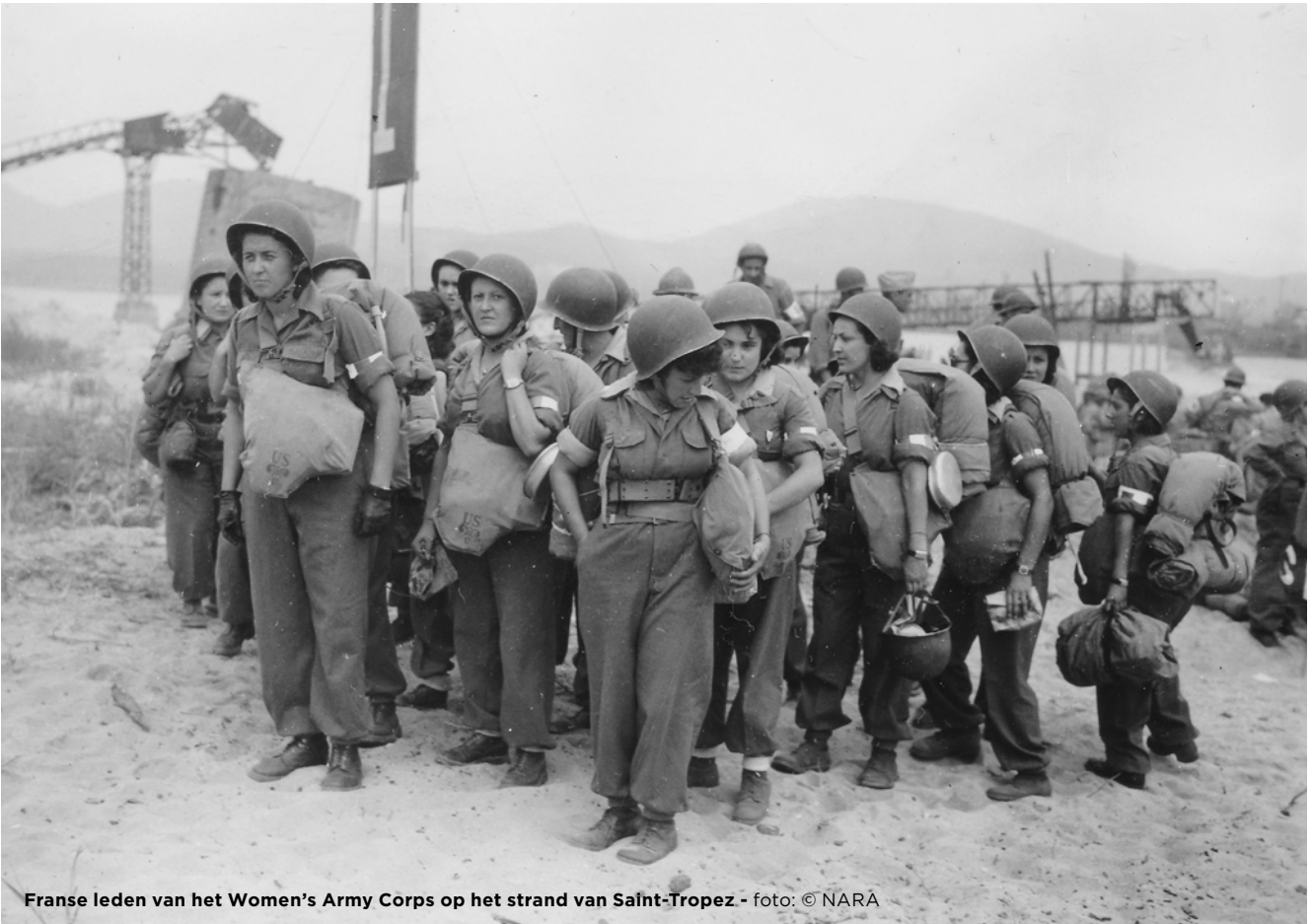
Franse leden van het Women's Army Corps op het strand van Saint-Tropez

‘Op 15 augustus veranderden we van planeet. De cultuurschok was heftig. We kwamen plotseling in een consumptiemaatschappij terecht. Producten kwamen in overvloed. Wit brood, thee, koekjes, sigaretten. We gingen naar het strand om alles op te halen.’