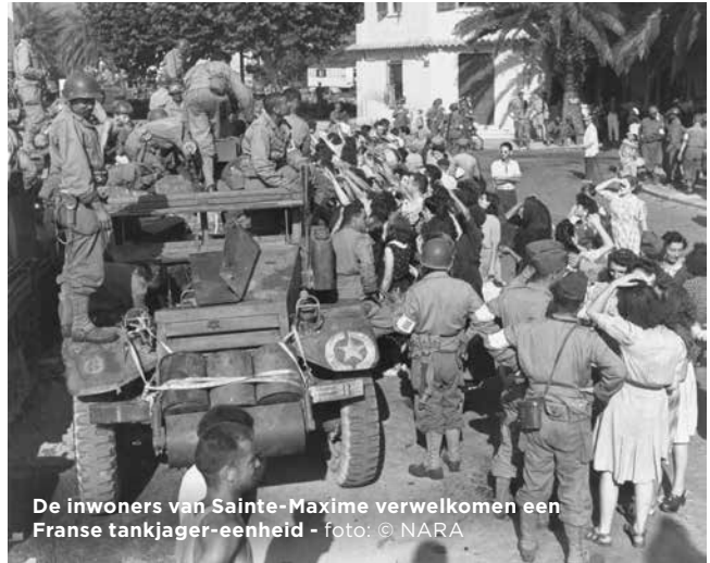
De inwoners van Sainte-Maxime verwelkomen een Franse tankjager-eenheid