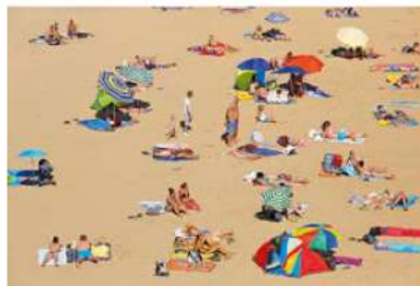
Cavalaire-sur-Mer, plage de Bonporteau